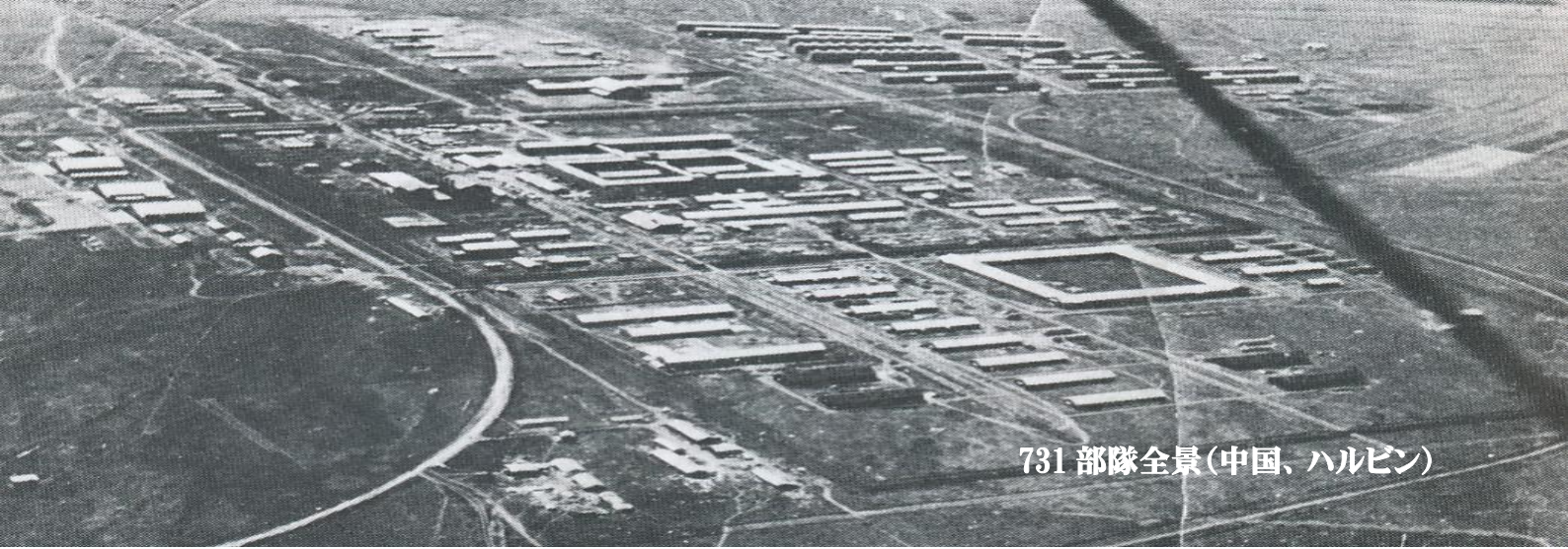
731 部隊全景(中国、ハルビン)